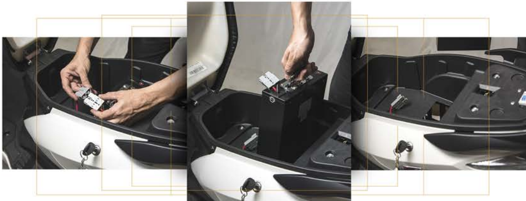
Batería de litio extraíble.